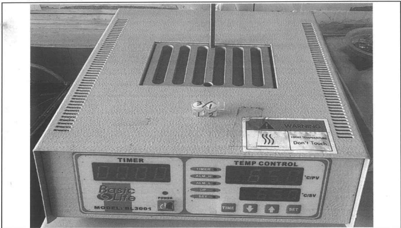
易克速 50 綜合抗生素檢驗結果照片