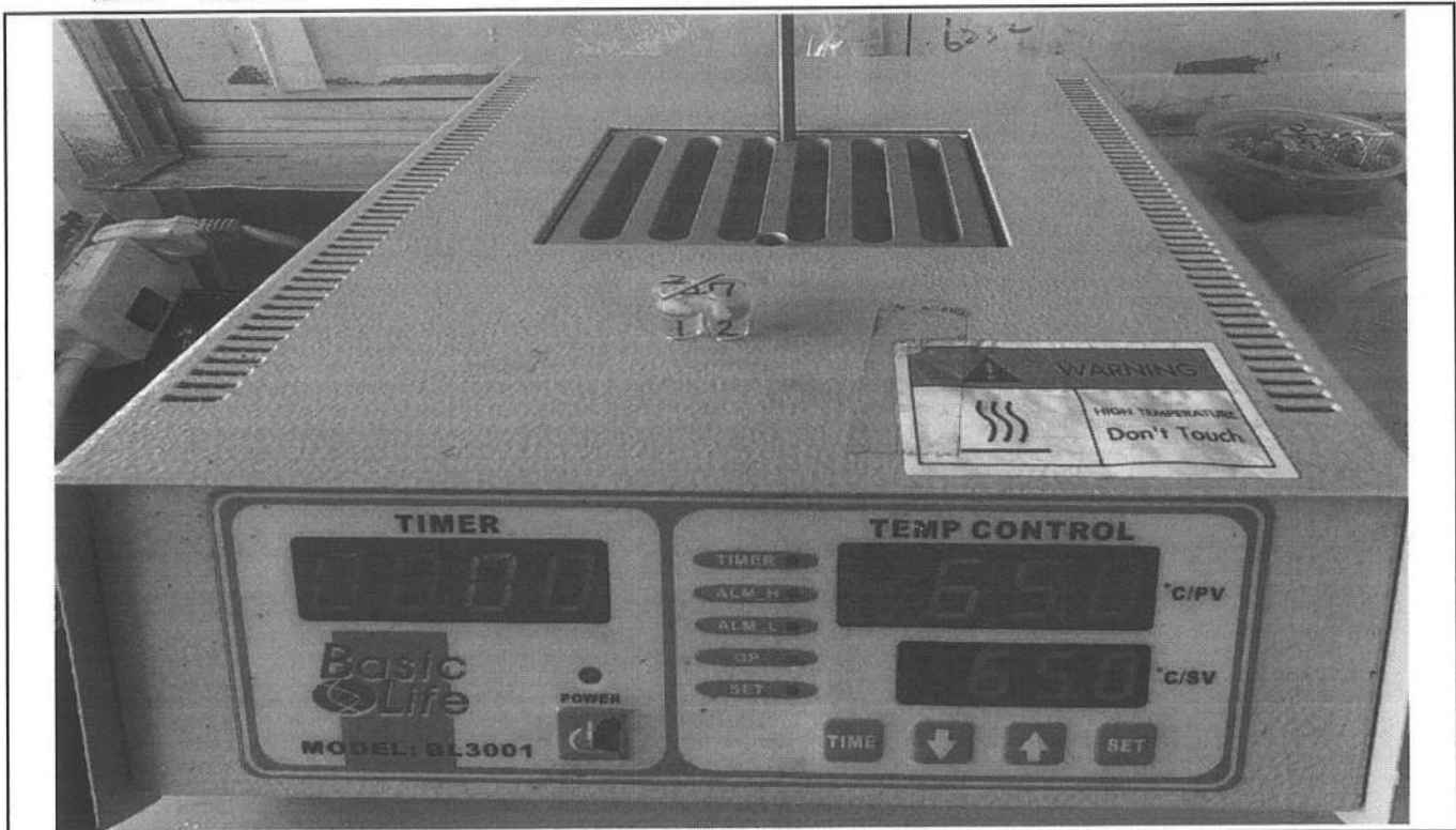
易克速 50 綜合抗生素檢驗結果照片