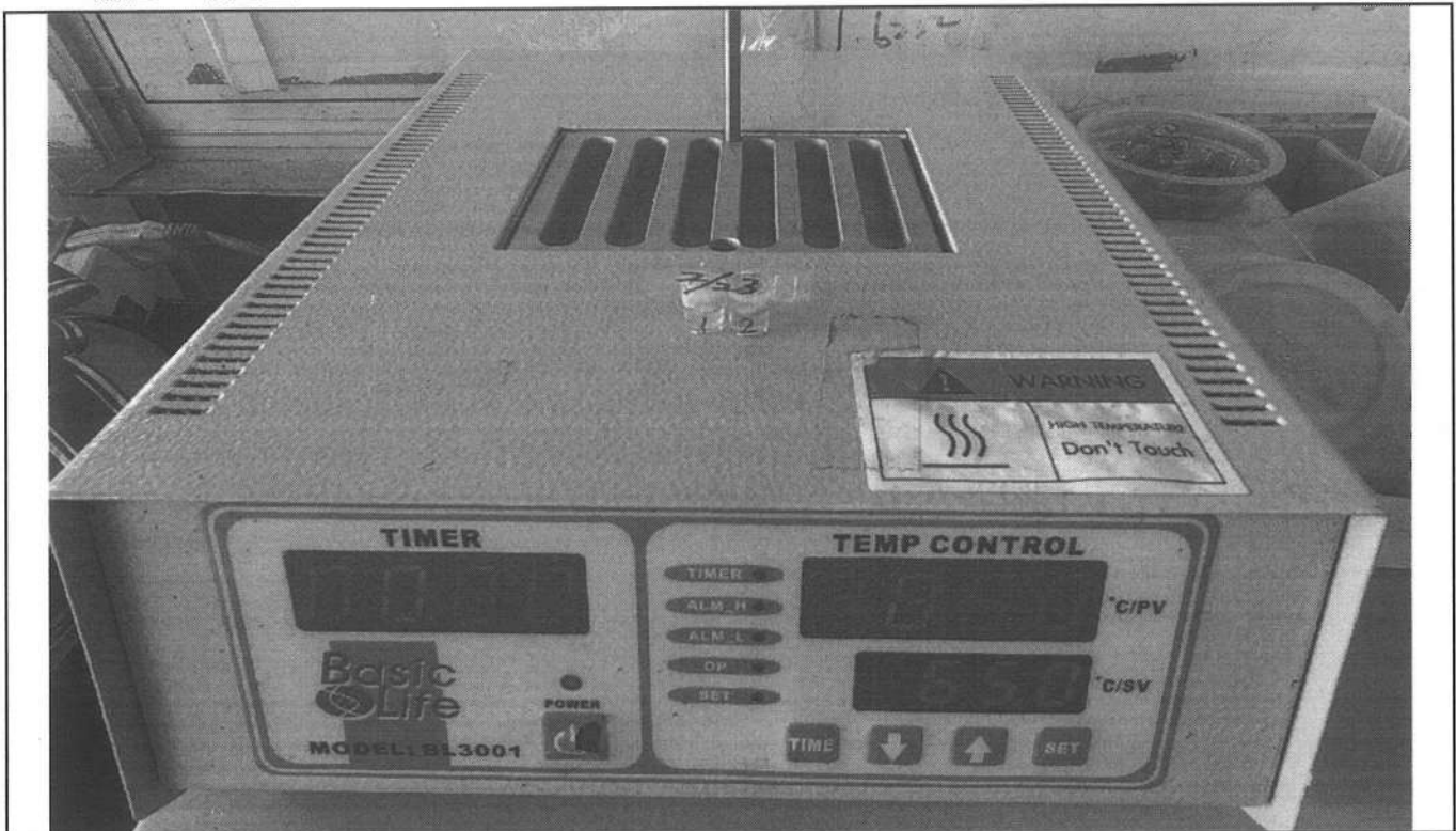
易克速 50 綜合抗生素檢驗結果照片