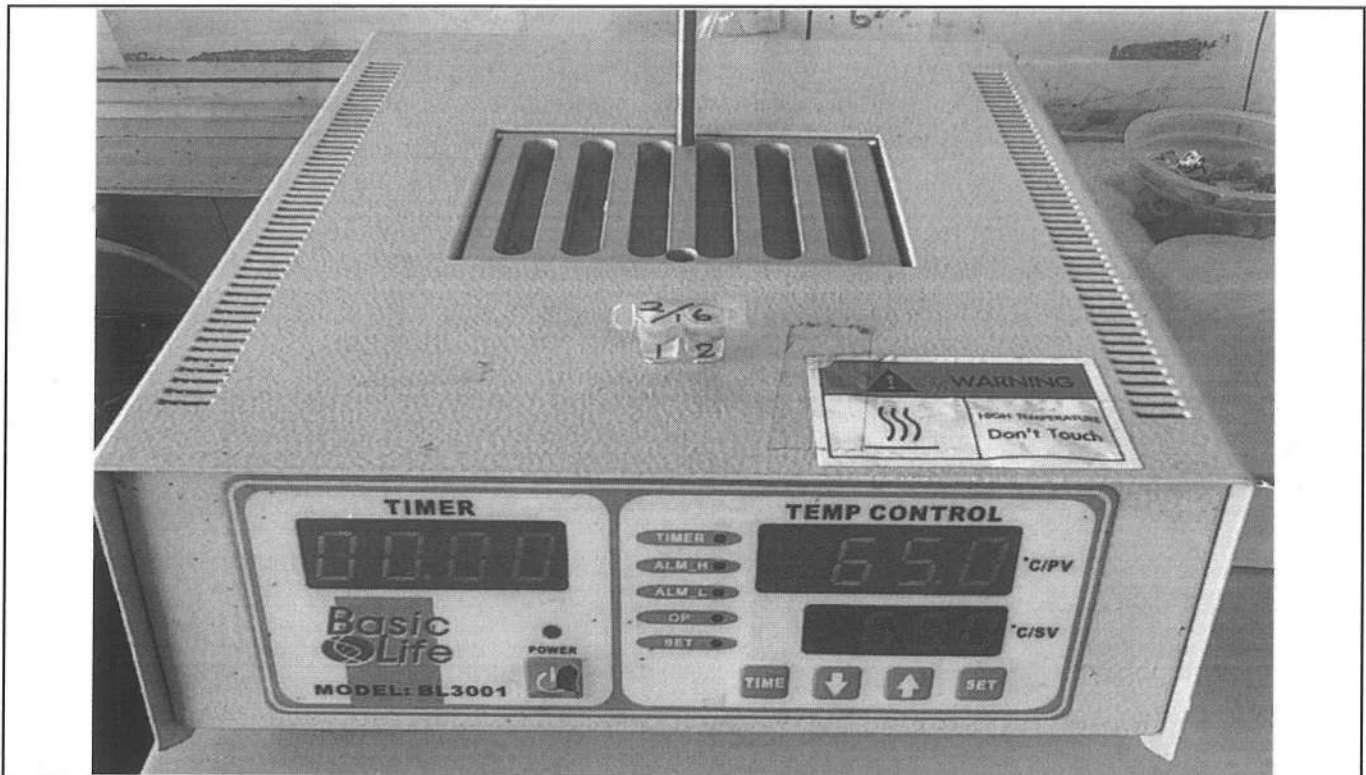
易克速 50 綜合抗生素檢驗結果照片