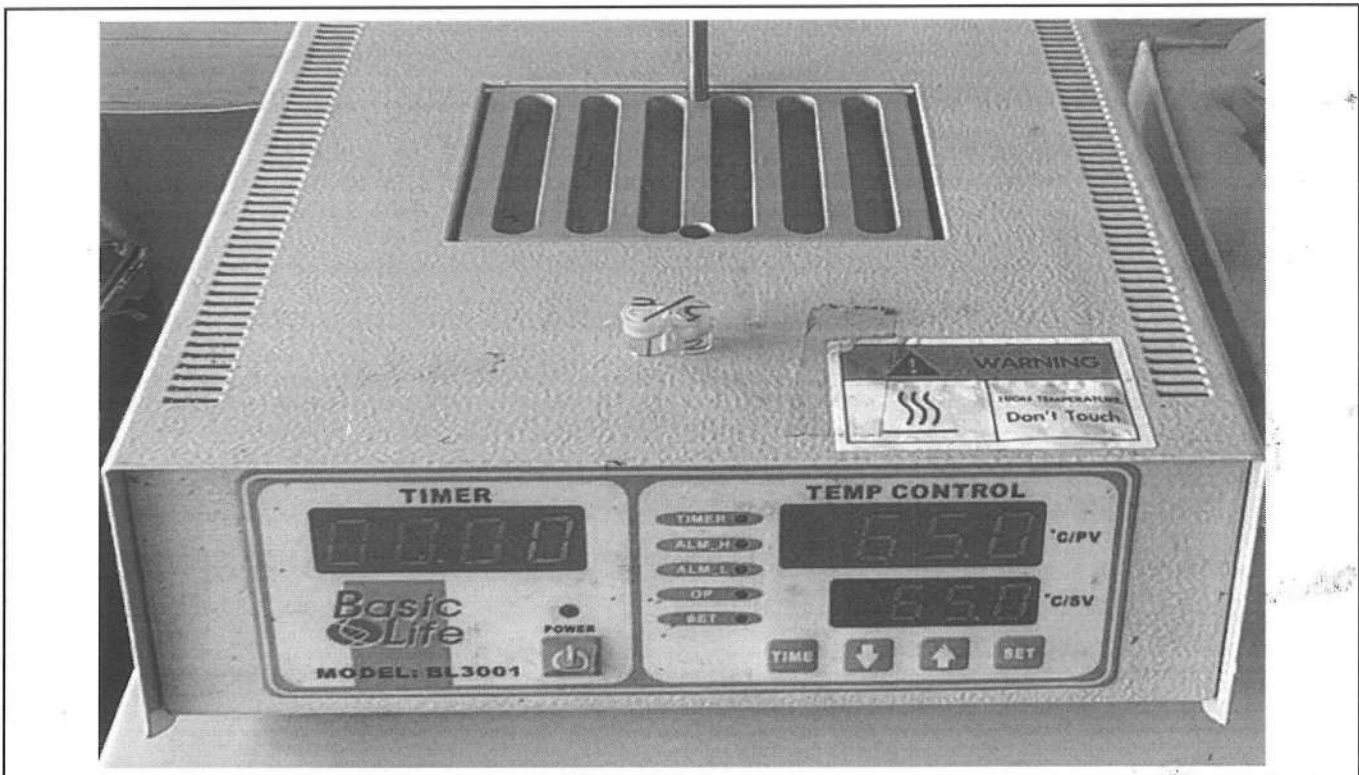
易克速 50 綜合抗生素檢驗結果照片