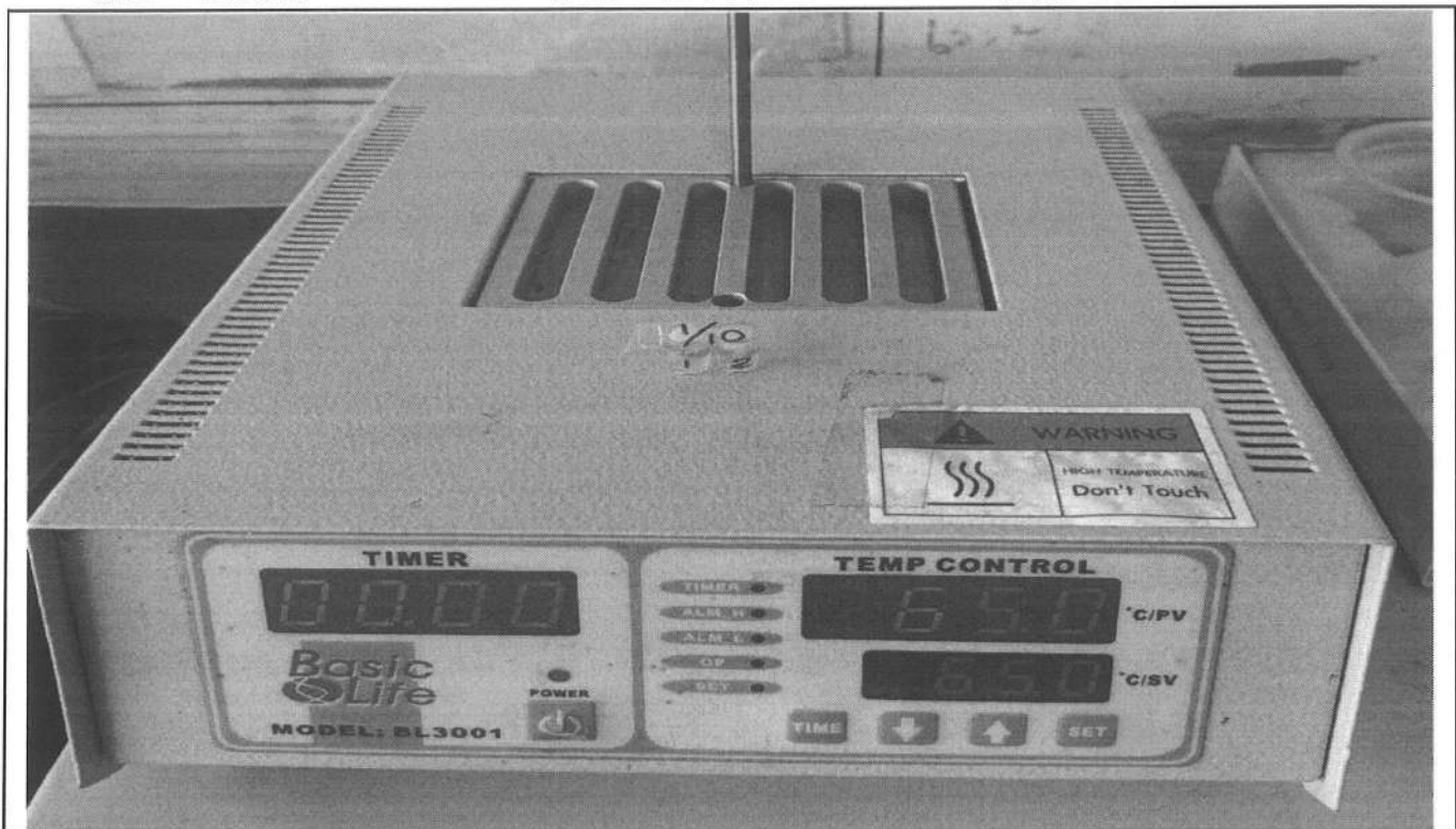
易克速 50 綜合抗生素檢驗結果照片