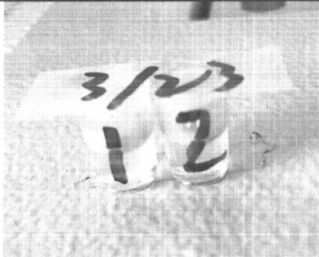
易克速 50 綜合抗生素檢驗結果照片