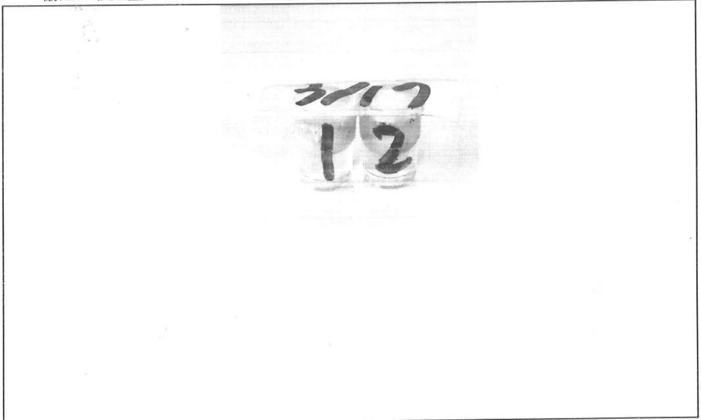
易克速 50 綜合抗生素檢驗結果照片