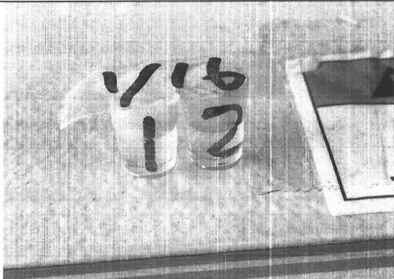
易克速 50 綜合抗生素檢驗結果照片