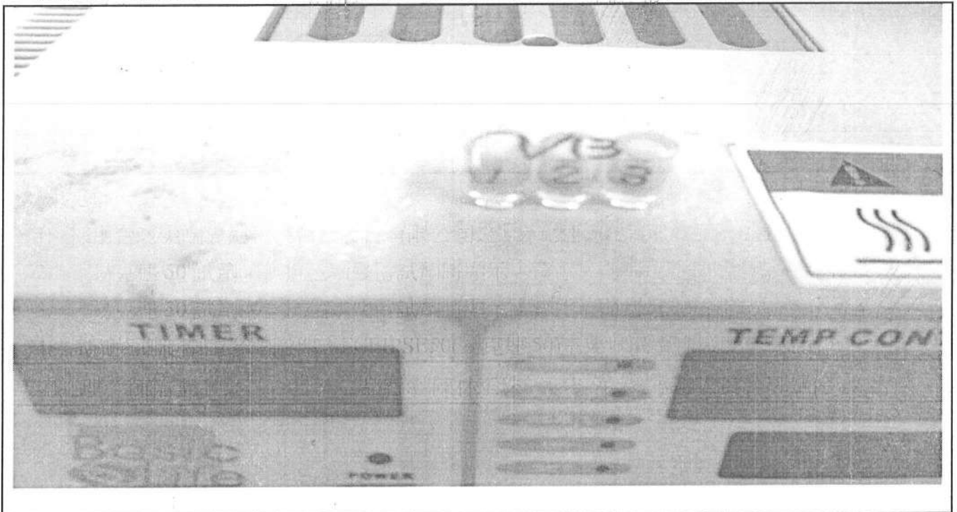
易克速 50 綜合抗生素檢驗結果照片