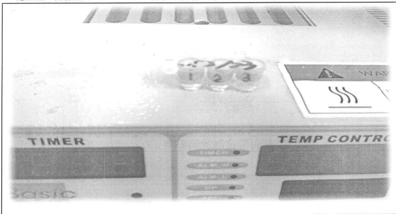
易克速 50 綜合抗生素檢驗結果照片