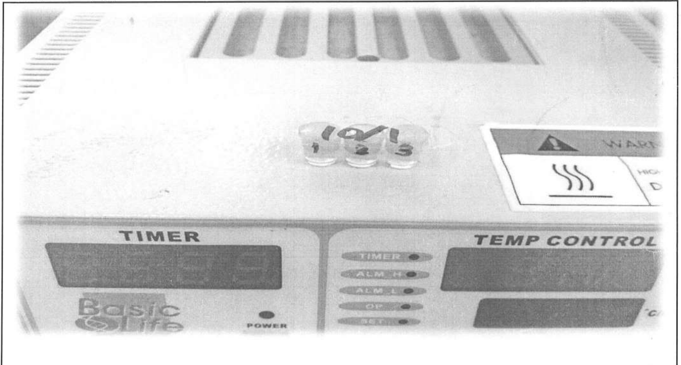
易克速 50 綜合抗生素檢驗結果照片